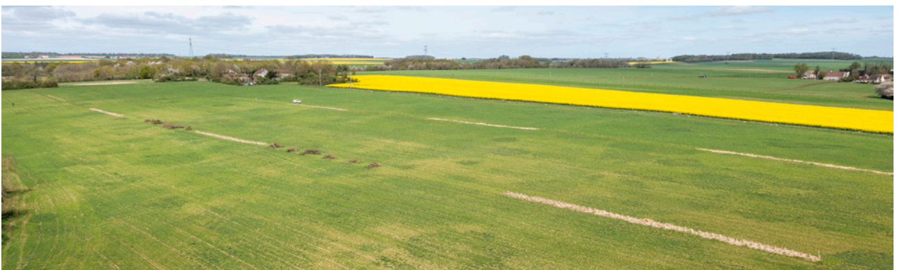
Dispositif expérimental de techniques alternatives à la plantation pour établissement de haies intraparcellaires.