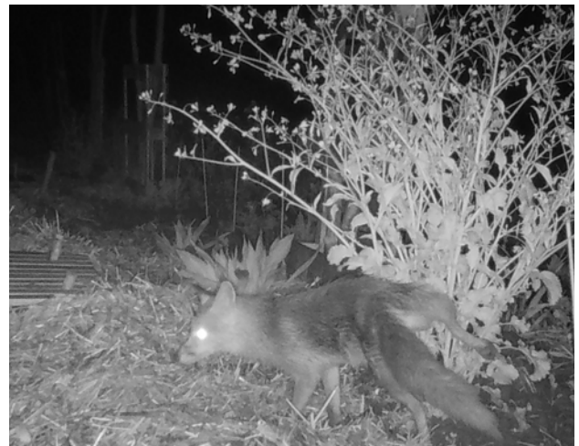
Renard surpris dans la nuit dans une modalité de semis sur paille.