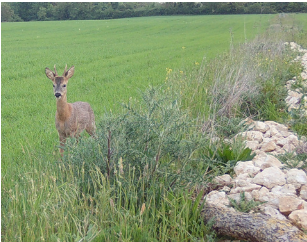
Chevreuil aux abords d'un andain de pierres.